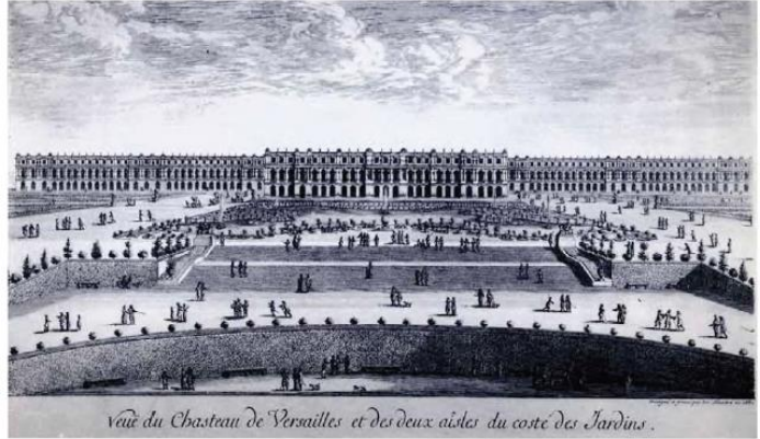
vue du Chateau de Versailles et des deux aisles du costé des Jardins.