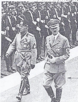
En 1922, Mussolini prit le pouvoir par la force en Italie, supprima les libertés individuelles et établit une dictature: ce régime fut appelé le fascisme.

Ce fut également le cas avec les nationalismes, notamment le fascisme en Italie et le nazisme en Allemagne.